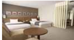
Deluxe Twin Room