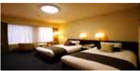
Superior Twin Room