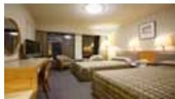
Standard Twin Room