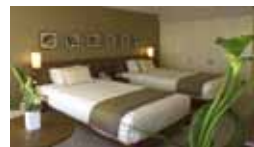
Plaza Premier Twin Room