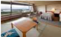
瑞松閣: 和洋式客房