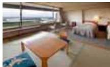
瑞松閣: 和洋式客房