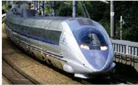
新幹線 Nozomi (のぞみ)