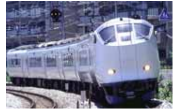
特急 Haruka (はるか)