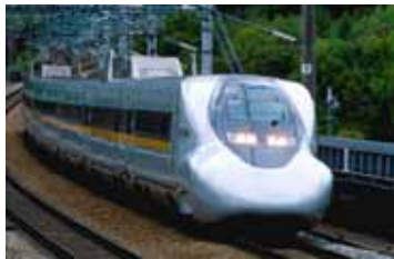
新幹線 Hikari Rail Star