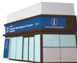
東武旅遊服務中心淺草 (舊稱: 東京觀光服務中心)