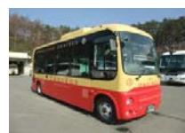
紅線：河口湖周遊巴士 沿途經過卡奇卡奇山纜車、河口湖遊覽船、河口湖美術館等景點