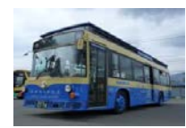
藍線：鳴澤/精進湖/本栖湖周遊巴士