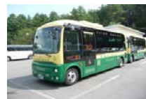
綠線：西湖周遊巴士 沿途經過西湖湖畔等景點